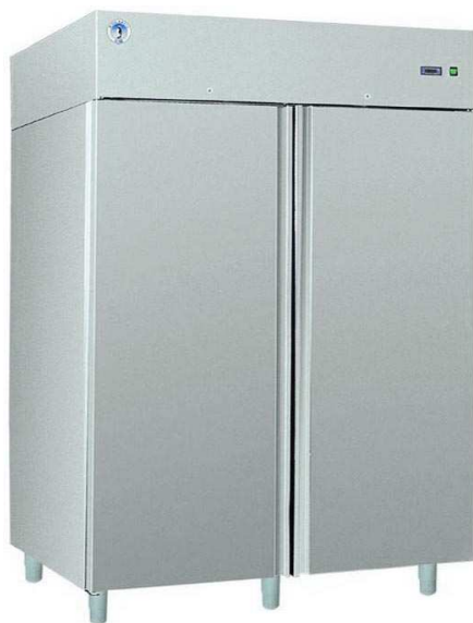
S-147 S INOX