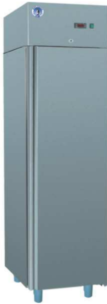
S-300 S INOX