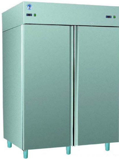
S/S-147 S INOX