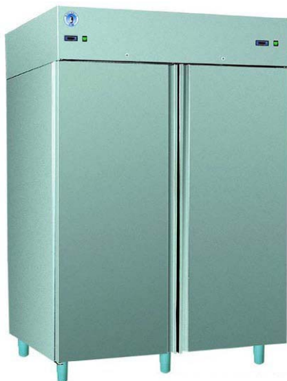
S/SN-147 S INOX