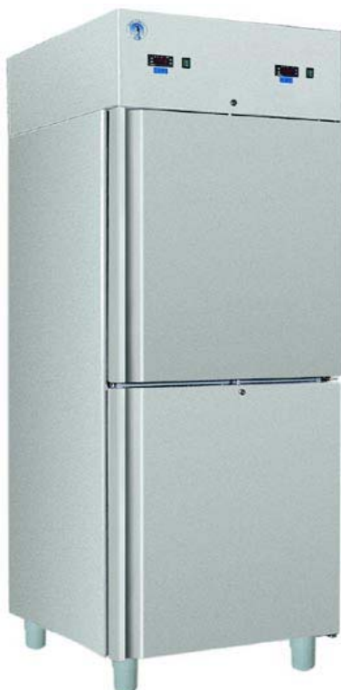
S/SN-711 S INOX