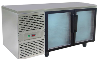
SCH-2 INOX drzwi przeszklone