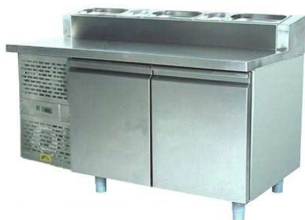
SCH-2 Pizza INOX