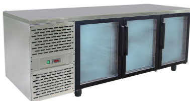
SCH-3 INOX drzwi przeszklone