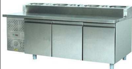
SCH-3 Pizza INOX