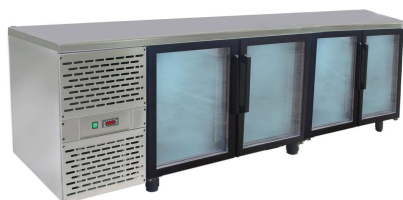
SCH-4 INOX drzwi przeszklone