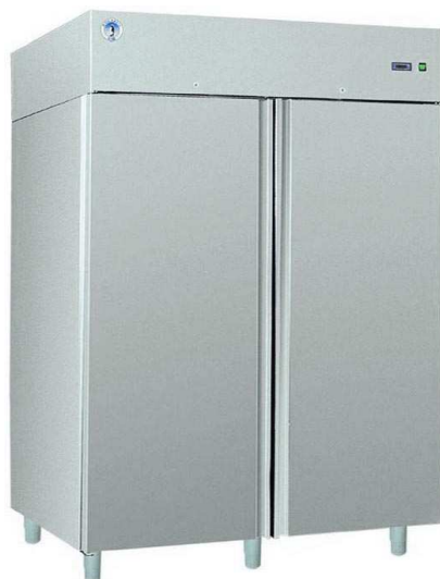
SN-147 S INOX