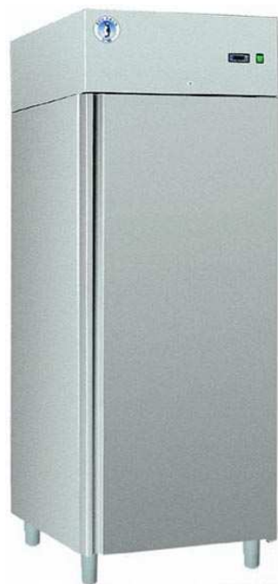
SN-500 S INOX