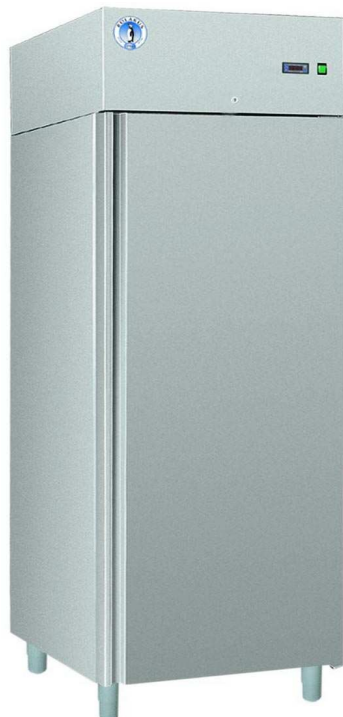
SN-711 S INOX