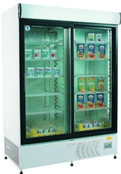
WS- 140 SR