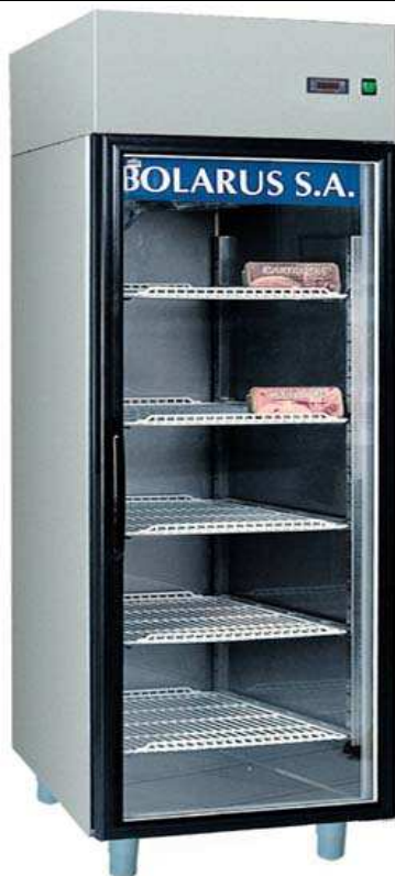
WS-711 S INOX