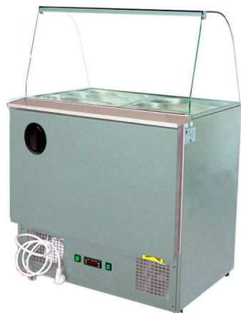
S-70 NS INOX