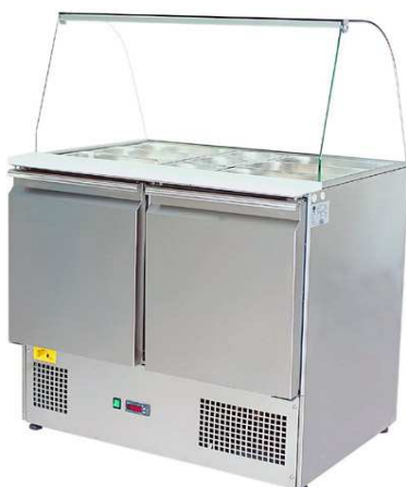
S-90 NS INOX