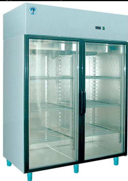
WS-147 S INOX